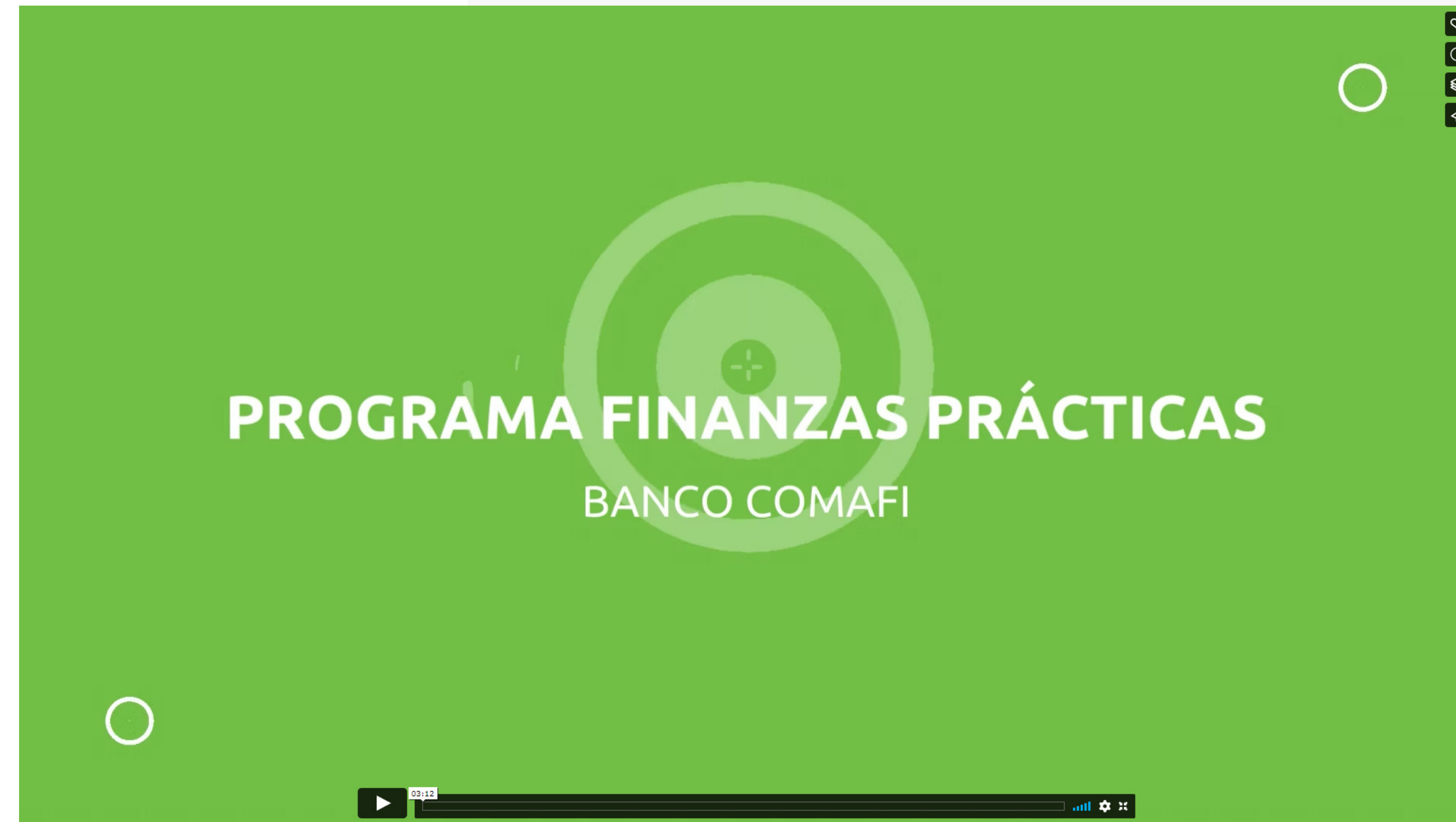
Banco Comafi - Programa Finanzas Prácticas